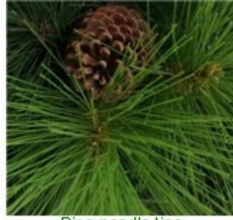
Pine needle tips