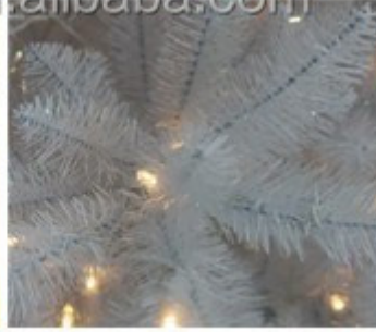
White tips (branches)