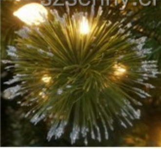
Glitter pine needle tips