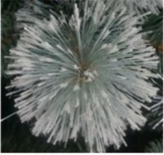
Flower needle tips