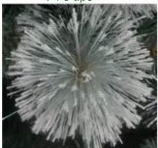
Flower needle tips