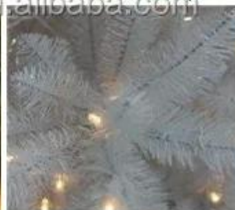
White tips (branches)