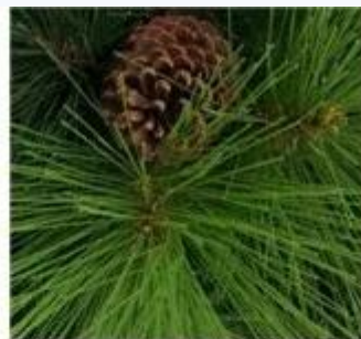
Pine needle tips