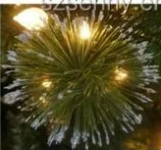
Glitter pine needle tips